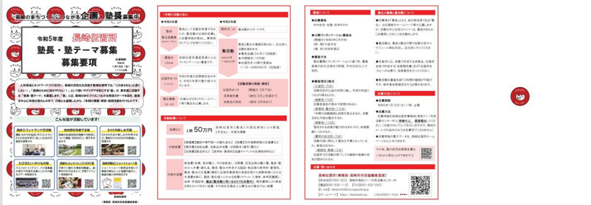
▲ チラシ(A3 両面)