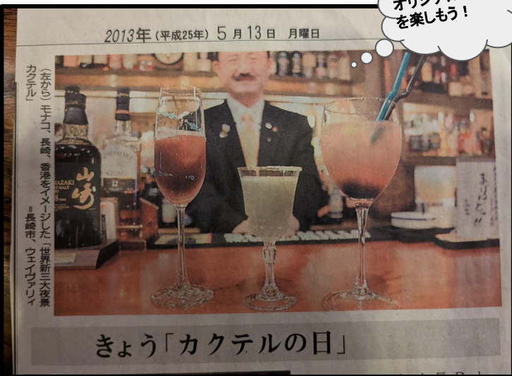
平成25年5月13日の新聞より。カクテル名「長崎」