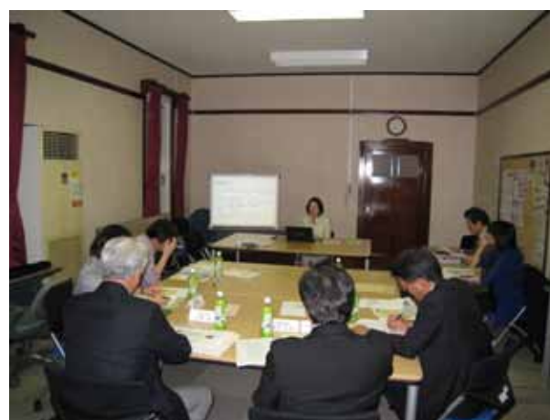
フォローアップ補助金審査会 (H24. 4. 18)