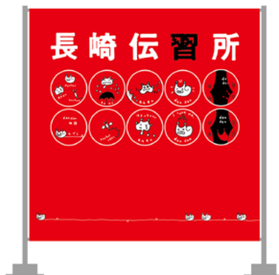
▲ バナー：タテ 230×ヨコ 230 cm