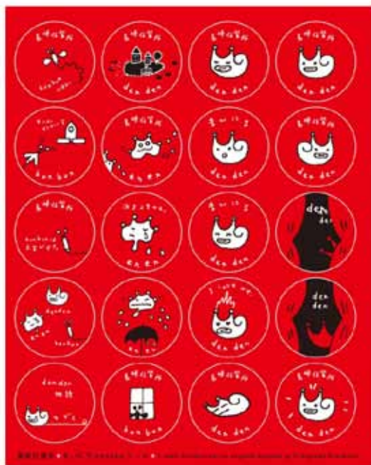
▲ 円形シール：直径 2.5cm(1 シート 20 枚)