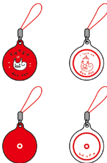
▲ 円形本体：直径 2.7cm(磁器)