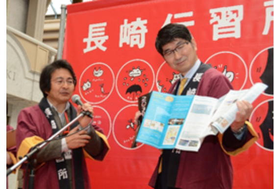
長崎伝習所まつり(3/20)①