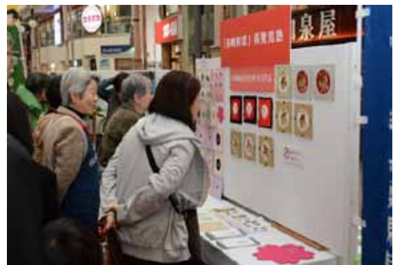
長崎伝習所まつり(3/20)③