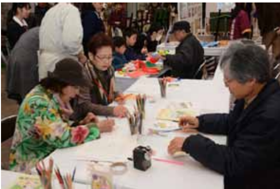
長崎伝習所まつり(3/20)②