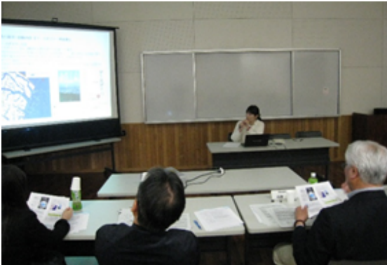
29年度「塾」企画審査会(2/12)