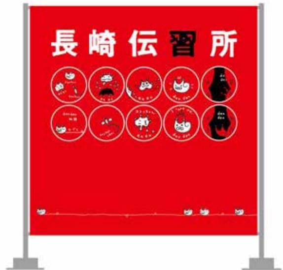
▲ バナー：タテ 230×ヨコ 230 cm