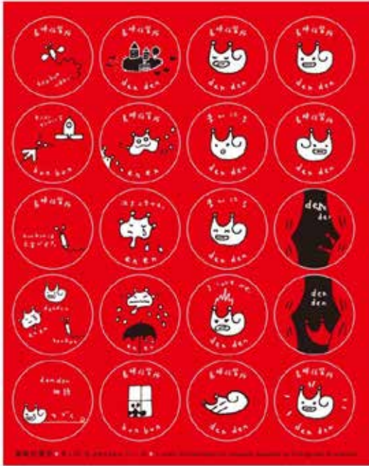
▲ 円形シール：直径 2.5cm(1 シート 20 枚)