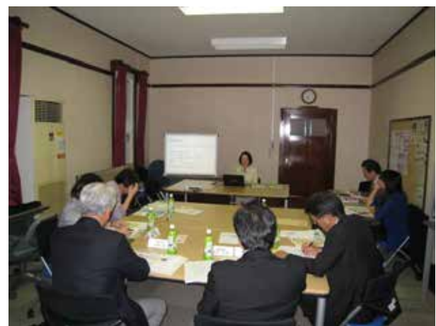
フォローアップ補助金審査会 (H24. 4. 18)