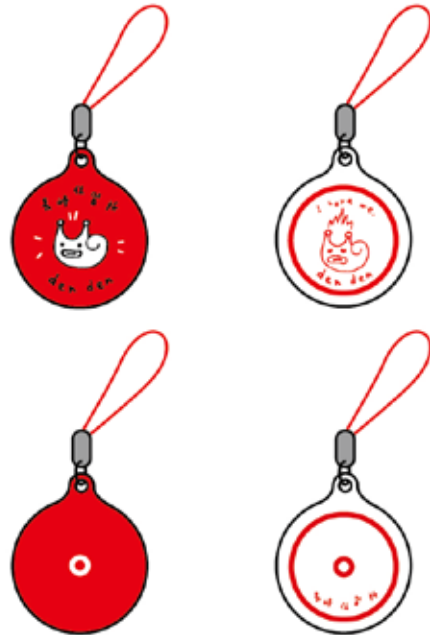
▲ 円形本体：直径 2.7cm(磁器)