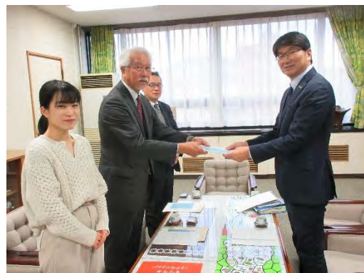
(報告書手交式の様子)