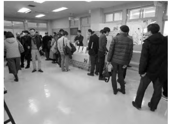
活動をデザインする活動 第6回 (1/26)