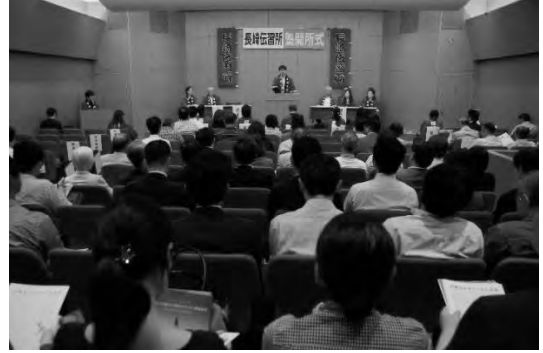
開所式 (5/23) ②