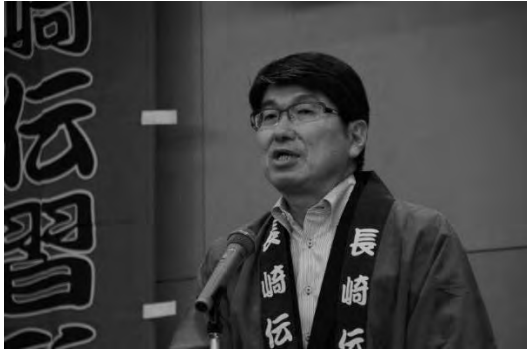
開所式 (5/23) ①