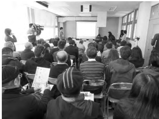
活動をデザインする活動 第6回 (1/26)