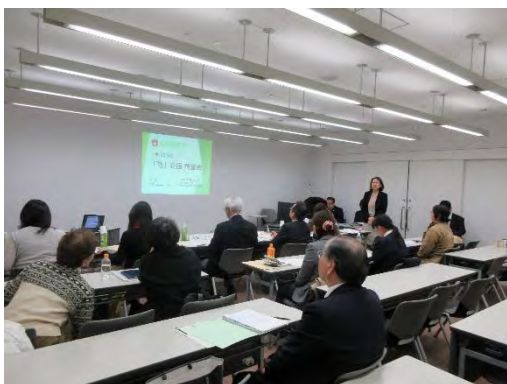
令和 2 年度「塾」審査会 (2/13) ①