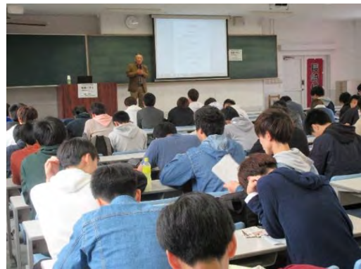
第 1 回特別講座 (11/18) ②