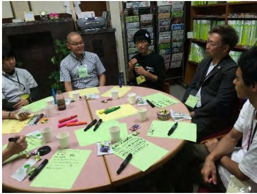
第 3 回カタリバ事業 (8/26)