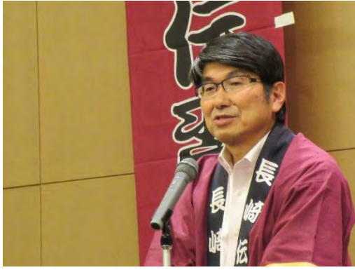
開所式 (5/21) ①