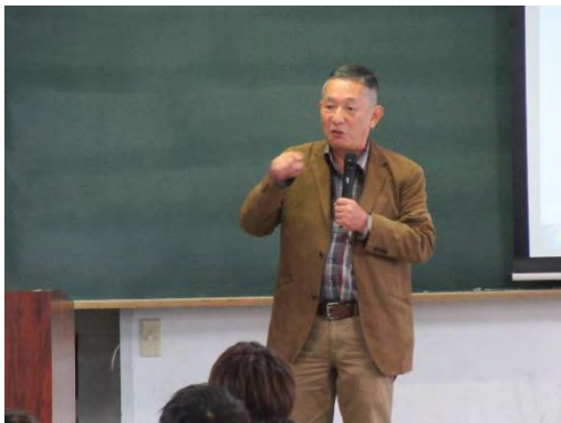
第 1 回特別講座 (11/18) ①