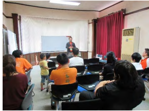
第 4 回カタリバ事業 (10/26)