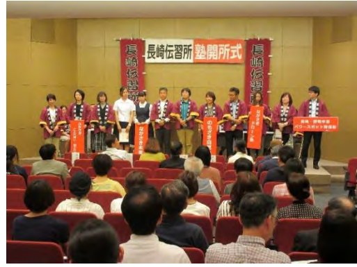
開所式 (5/21) ②