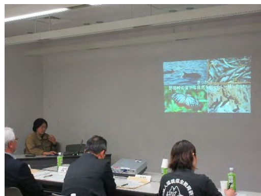
令和 2 年度「塾」審査会 (2/13) ②