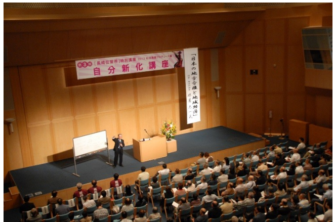
自分新化講座第2回(10/14 堺屋太一氏)