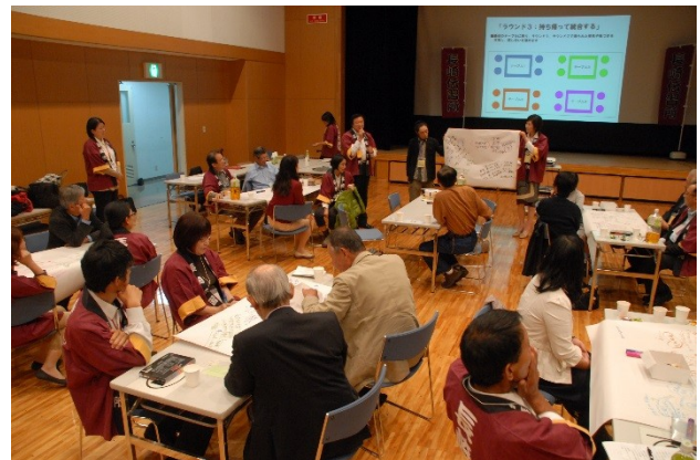
塾活動中間報告会(10/15)③