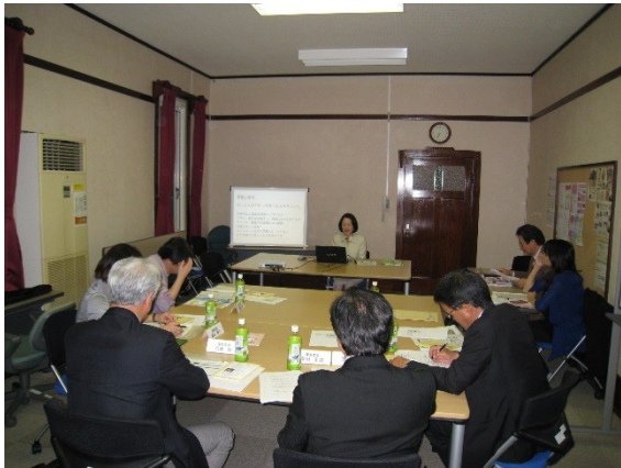
フォローアップ塾審査会(4/18)