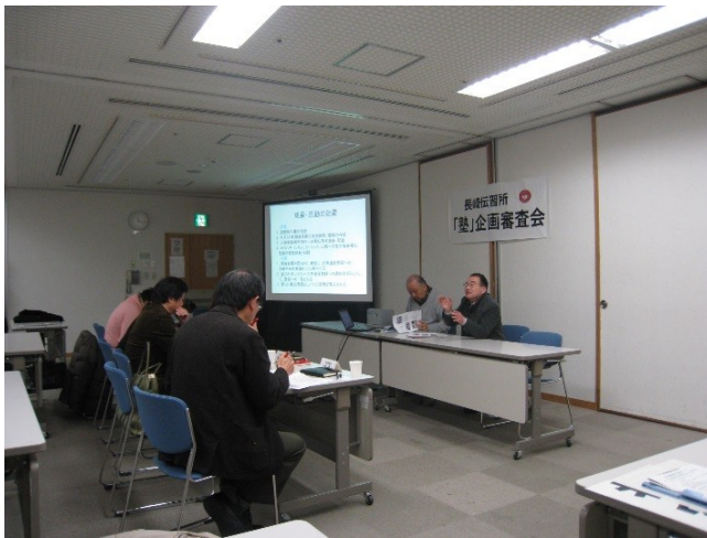
26年度「塾」企画審査会(2/16)