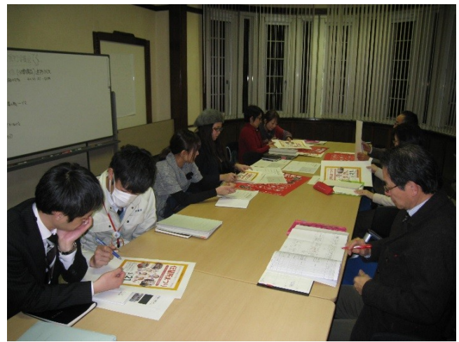
伝習所まつり実行委員会(2/24)