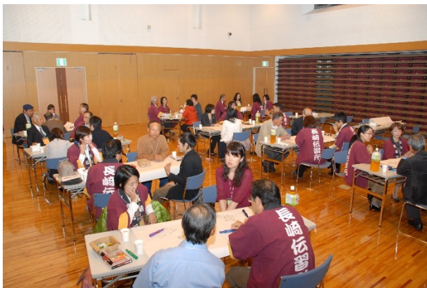
塾活動中間報告会(10/15)②