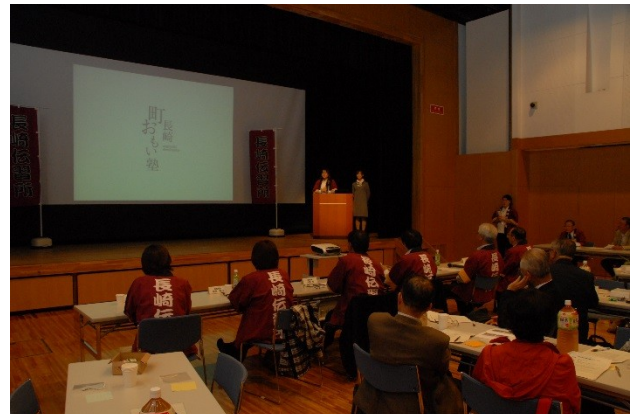
塾活動中間報告会(10/15)①